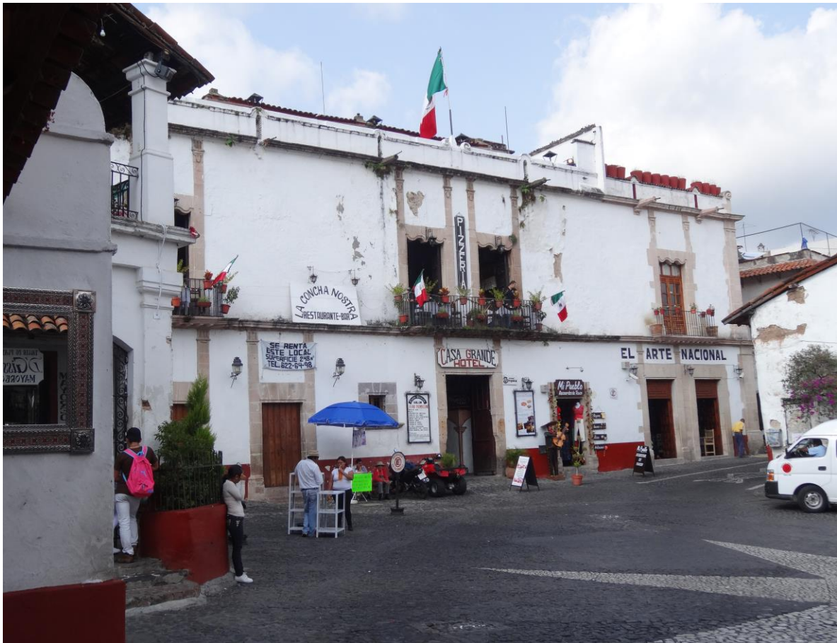
FIGURA 3. IMAGEN DE LA FACHA DEL HOTEL CASA GRANDE