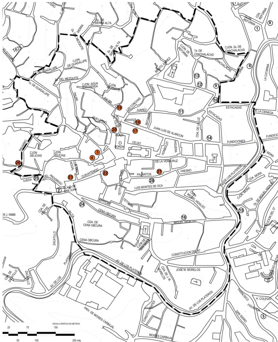
FIGURA 2. UBICACIÓN DE LOS HOTELES CON MONUMENTO

3. Posada los Balcones 4. Hotel Real de Minas 17. Hotel Emilia 18. Hotel Los Arcos