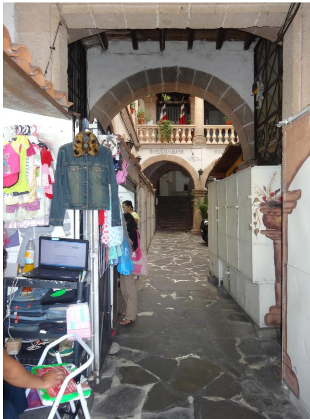
FIGURA 7. LOCALES COMERCIALES EN EL HOTEL CASA GRANDE, EXPLOTACIÓN COMERCIAL DEL MONUMENTO.

Debido a la falta de orientación a los dueños de los hoteles declarados monumento histórico, no se proporciona la adecuada conservación, eventualmente debido a sus escasos recursos económicos. Explotan el inmueble comercialmente (Figura 7) e incorporan materiales y elementos que no van acorde con el sistema constructivo y estilo arquitectónico original.