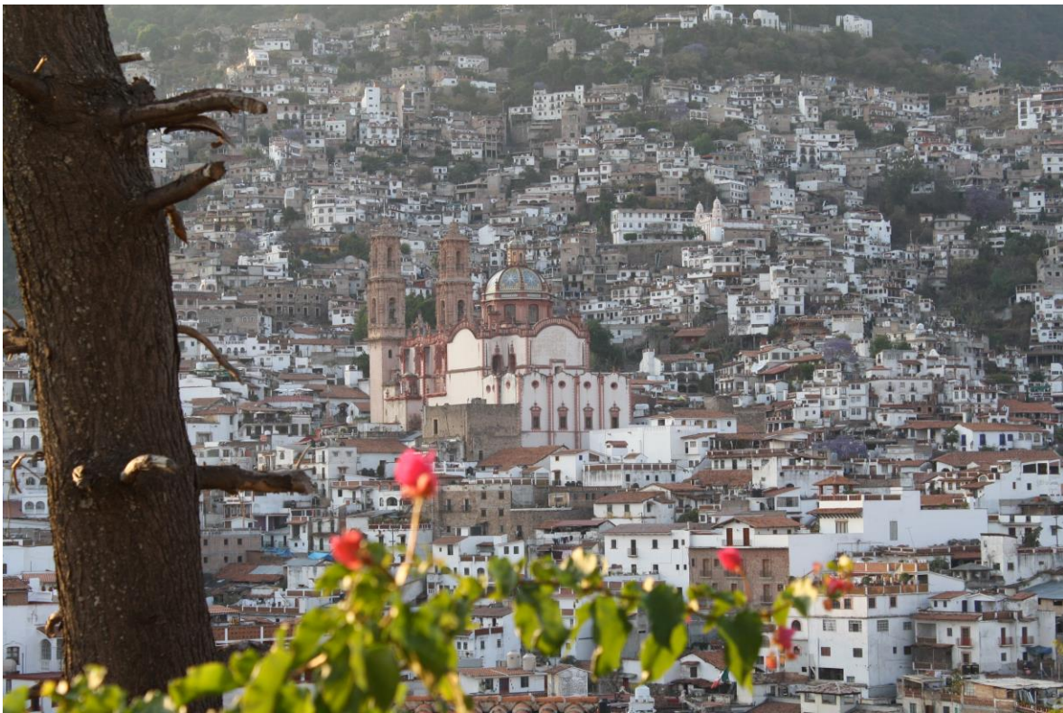
FIGURA 1. ARQUITECTURA DE TAXCO DE ALARCÓN, EN FORMA ESCALONADA

En México, Taxco es una de las localidades pioneras en la implementación de políticas para la conservación de su patrimonio construido, aplicadas poco después del inicio del turismo, lo que evitó la destrucción de su centro histórico. En 1928 se constituyó la asociación “Amigos de Tasco” y se emitió la primera “Ley para la conservación de Tasco”. En 1936, fue declarada Población Típica y de Belleza Natural, bajo la Ley Nacional aprobada en 1934, sobre Protección y Conservación de Monumentos Arqueológicos e Históricos, Poblaciones típicas y Lugares de Belleza Natural (Flores, 2007:35-36). Esta ley fue elaborada con el propósito de resguardar los centros turísticos con atractivos culturales históricos. Tanto las antiguas leyes, como la que hoy rige a este poblado, la número 174 del estado de Guerrero, ayudaron a la preservación de su arquitectura, al delimitar los lineamientos para el mantenimiento de los monumentos históricos y la construcción del resto de las edificaciones.