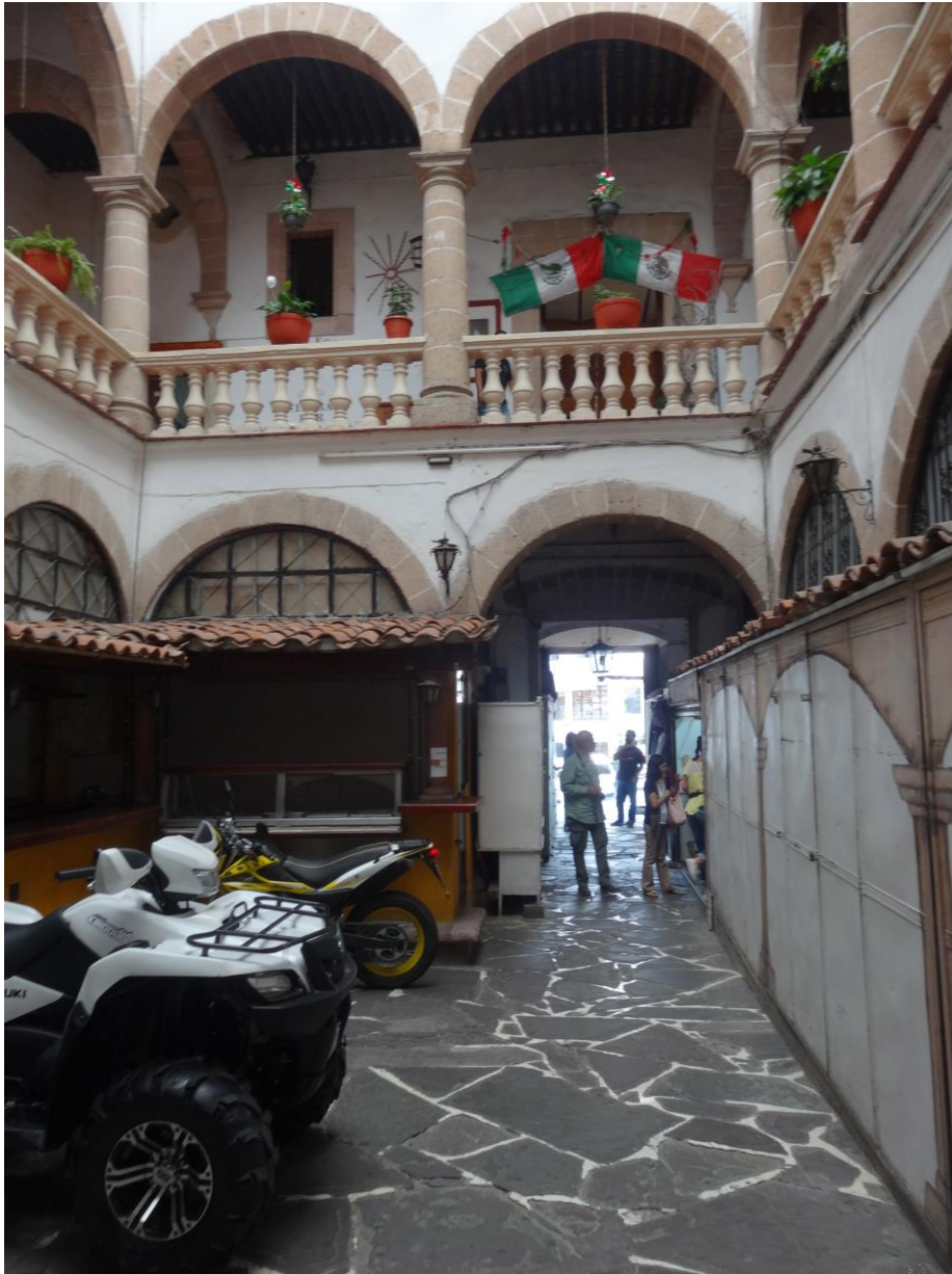
FIGURA 4. INTRODUCCIÓN DE ELEMENTOS ARQUITECTÓNICOS QUE ROMPEN CON LA ARQUITECTURA ORIGINAL HOTEL CASA GRANDE.