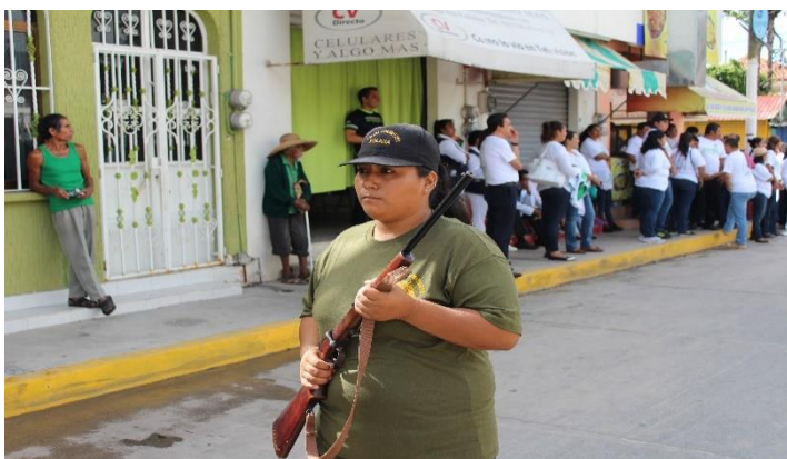
Foto 1.- Martínez, Alaide. “Marcha por la libertad de los presos de la CRAC”. Tixtla, Guerrero. Fotografía. 2016.

En el año 2010 se da conocer un documento que expresa, de acuerdo a resoluciones de asambleas y talleres, los puntos principales que ellas valoran como sus derechos, dicho documento lleva por nombre “Carta de los Derechos de las Mujeres en Territorio Comunitario” el cual consta de 15 acuerdos. Menciona como introducción la carta “Para garantizar que en todo el Territorio Comunitario las mujeres vivan con dignidad y libres de violencia, que se reconozca el valor de su