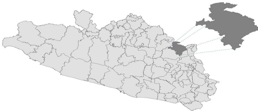
Imagen 1.- Ubicación del municipio de Olinalá

El 26 de Octubre del 2012 ocurrió un hecho que provocaría la furia de los habitantes, encontraron ejecutado a un joven taxista que había estado en calidad de desaparecido. Cuando familias, amigos y vecinos del lugar participaban en la ceremonia fúnebre se corrió el rumor del secuestro de un taxista más, un hombre conocido en la cabecera municipal por ser trabajador y tranquilo. 42