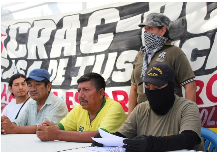
Foto 3.- Martínez, Alaide. “Conferencia de prensa de la Policía Comunitaria de Tixtla, Guerrero. La comandanta del lugar da un mensaje.” 10 de abril, 2016.

Las relaciones de género descritas teóricamente aquí son claras, los hombres han dominado y las mujeres han estado en una condición de sumisión, aceptando y promoviendo el machismo, pero esto es porque así ha sido designado, no se le puede culpar por formar a los machos, porque el machismo es construcción social, al igual