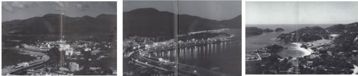
Figura 1. Tres grandes planos generales de la ciudad de Acapulco