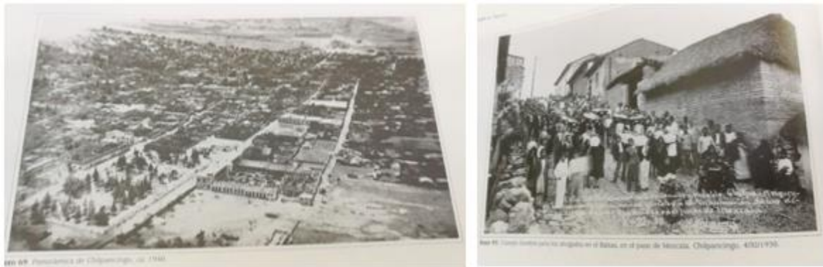
Figura 3. Foto 1: Panorámica de Chilpancingo, ca. 1940; foto 2: Cortejo fúnebre para los ahogados en el Balsas, en el paso de Mezcala. 4/XI/1930 8

Dentro del texto hay varias vistas entre 1930 y 1940; de ellas, hay dos que llaman la atención para los fines aquí propuestos (Figura 3). La primera, registrada en 1940, de Amando Salmerón, es una panorámica aérea, de forma oblicua, que intenta abarcar la ciudad. En primer plano se observa la Alameda y las instalaciones de la universidad, ubicadas ambas a tres cuadras del centro hacia el norte; es decir, tomada de norte a sur. En total, siguiendo las avenidas que se visualizan con toda claridad, se pueden contabilizar cerca de las 10 cuadras que la ciudad alcanzaba en ese momento. Por el encuadre resulta un poco más complicado anotar lo mismo de oeste a este, aunque sabiendo que el límite poniente es el río, podemos presumir que el espacio que se visualiza en la imagen es la primera cuadra.