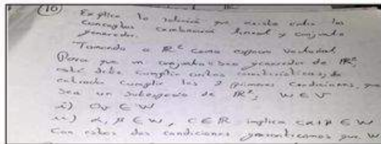
Figura 4. Confusión entre subespacio y conjunto generador.

Ahora bien, en general se mostró que los alumnos tienen dificultad para reconocer las características que debe tener un subconjunto de un espacio vectorial dado para generarlo y la relación entre combinación lineal y conjunto generador, sin embargo, la mayoría de los estudiantes sí verificaron cuándo un conjunto de vectores puede generar a un espacio dado si el espacio es \mathbb{R}^2 , \mathbb{R}^3 .