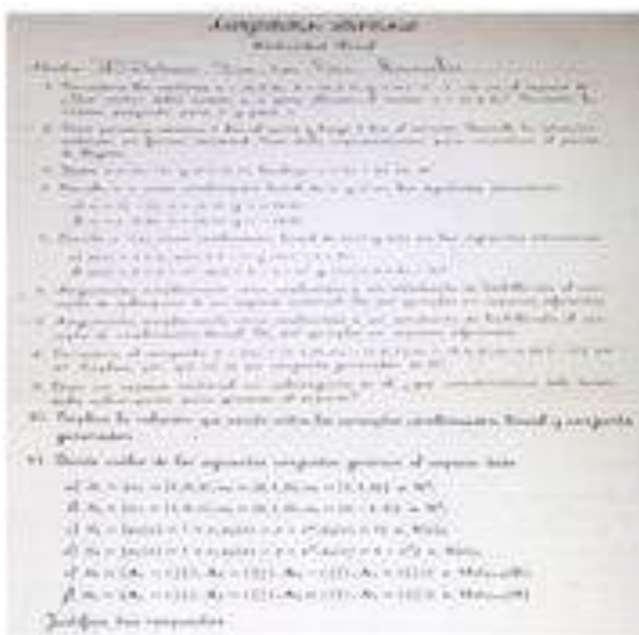
Figura 1. La actividad aplicada.

De forma sistémica todas las actividades tuvieron como objetivo formar el concepto conjunto generador y en este sentido se pudo vislumbrar sobre las dificultades que presentan los estudiantes respecto de éste (véase Figura 1).