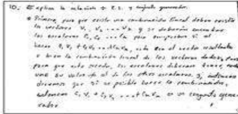
Figura 3. Interpretación errónea de combinación lineal.

Otra dificultad que se observó en la resolución de la pregunta diez, pues el estudiante confunde el concepto de conjunto generador por el de subespacio (véase Figura 4).