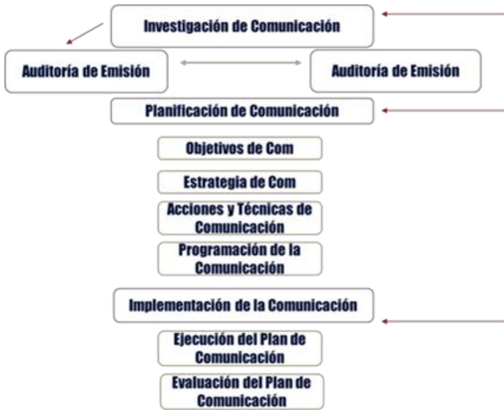
Imagen 2: Capriotti, fases para una planificación sistemática y coherente de la comunicación corporativa