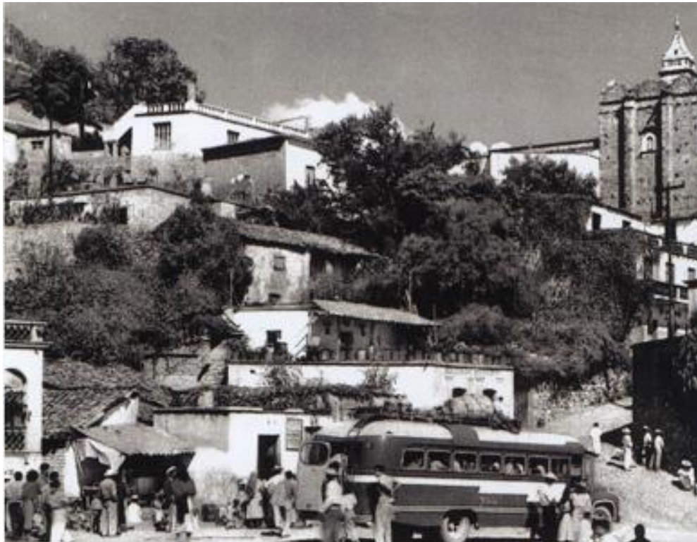
Figura 1. Vista de antiguas construcciones escalonadas de Taxco de Alarcón, Gro.

Por su actividad minera, es una ciudad asentada en un terreno con una topografía accidentada, lo que ofrece un panorama con predominio de construcciones escalonadas, con terrazas o techos de teja; se distingue por su arquitectura con características de la época colonial, lo que atrae en gran medida a los viajeros.