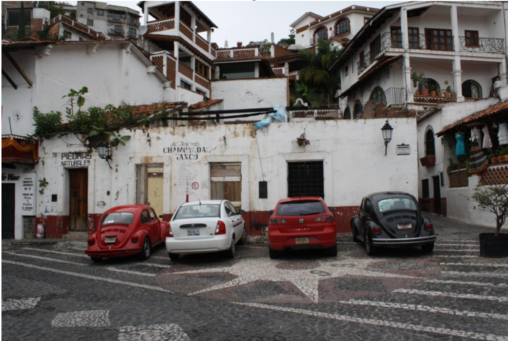
Figura 3. Esta imagen muestra una construcción deteriorada y abandonada, ubicada en una de las vías más importantes de Taxco.