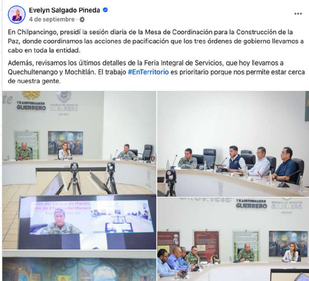
Imagen 5. Sesión diaria de la Mesa de Coordinación para la Construcción de la Paz.