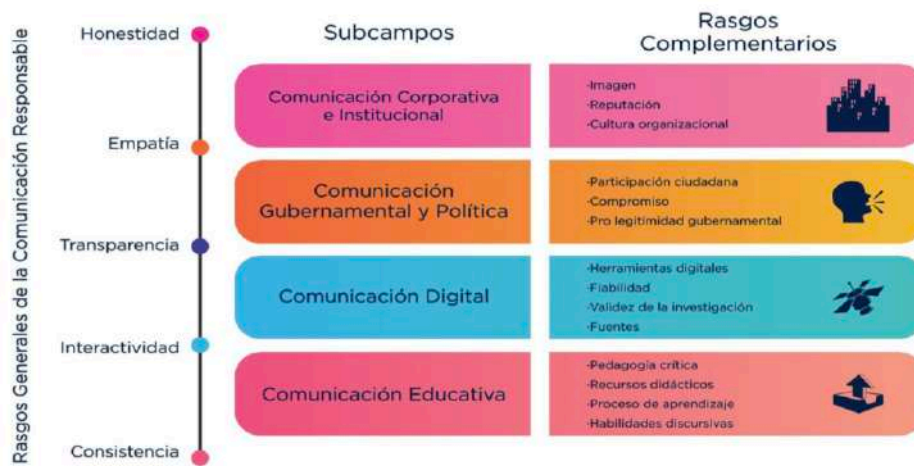
Figura 2. Rasgos Generales de la CR