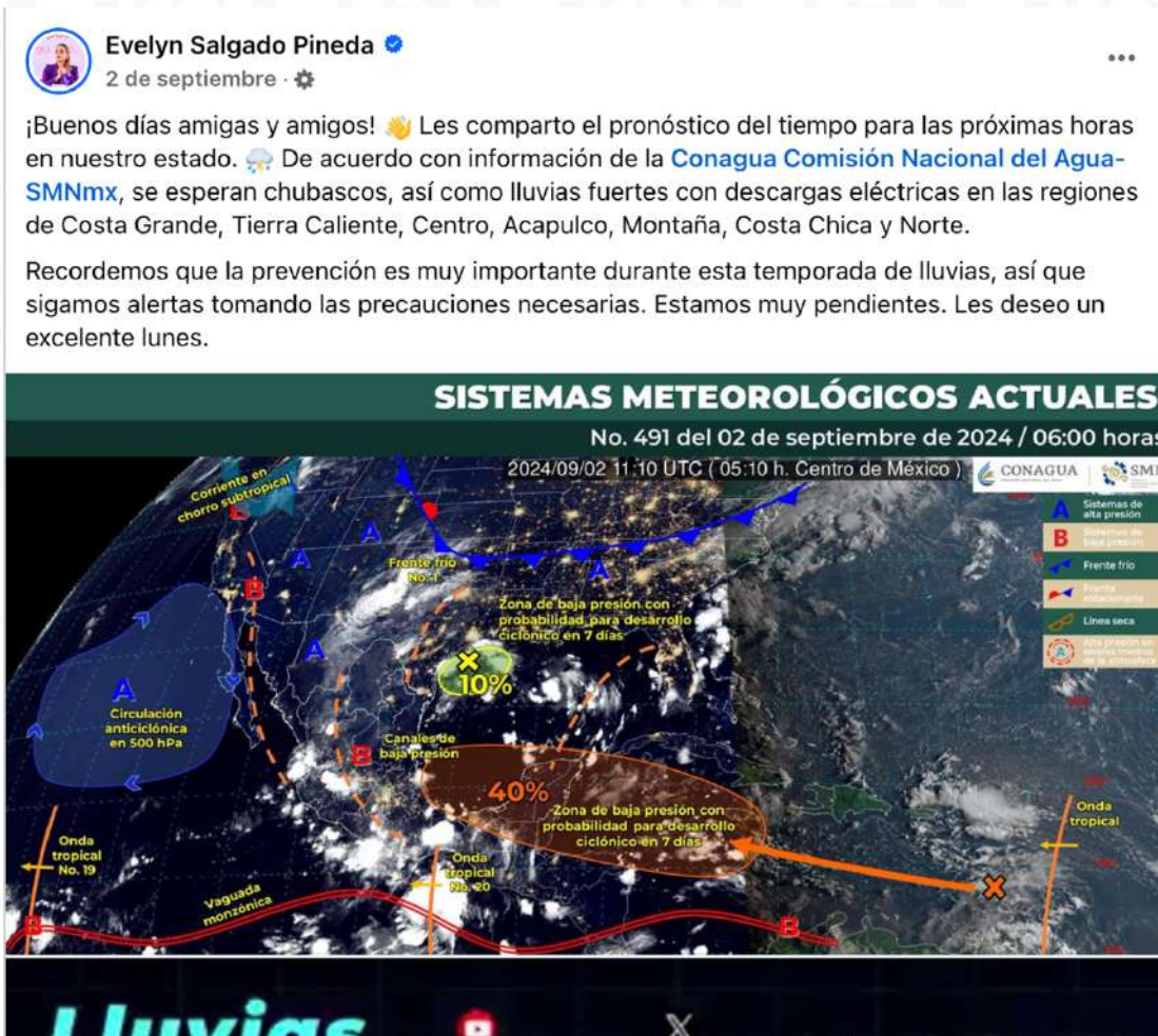
Imagen 2. Pronóstico del tiempo.