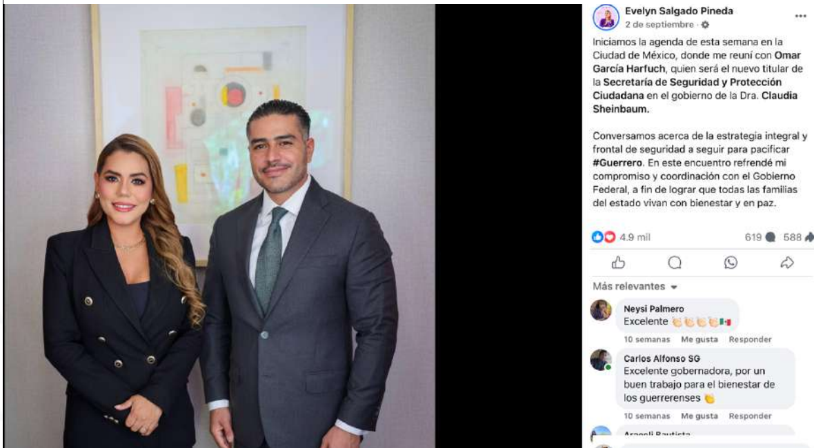
Imagen 1. Reunión con Omar García Harfuch, quién será el nuevo titular de la Secretaría de Seguridad y Protección Ciudadana en el gobierno.