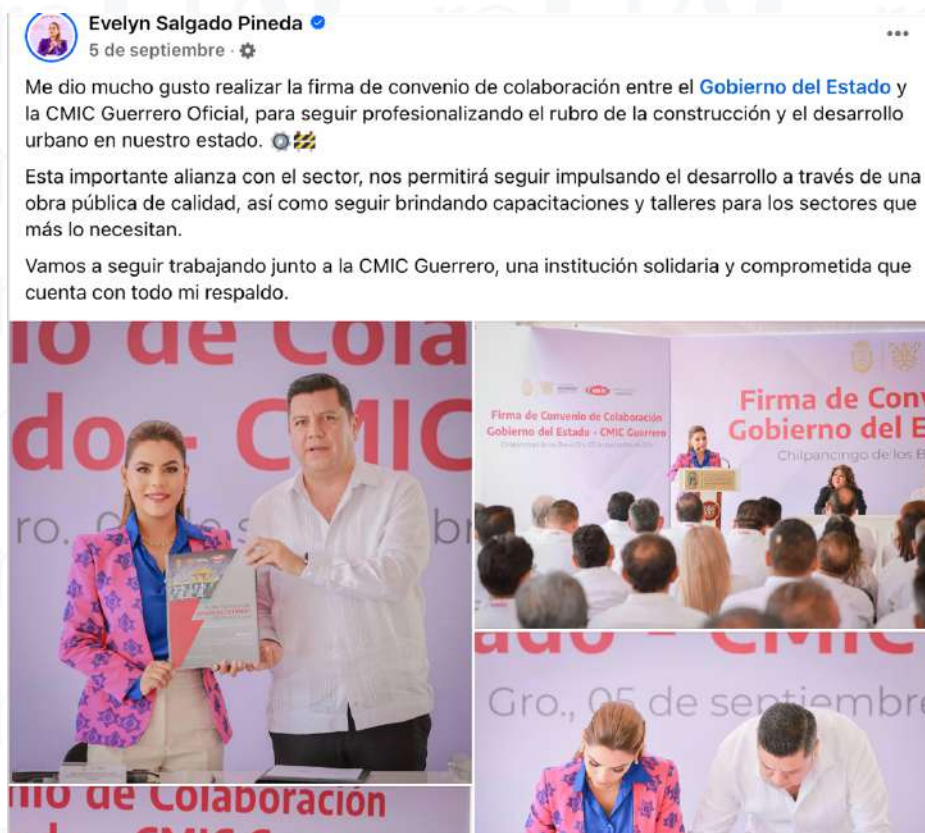
Imagen 6. Firma de convenio de colaboración entre el Gobierno del Estado y la CMIC Guerrero.